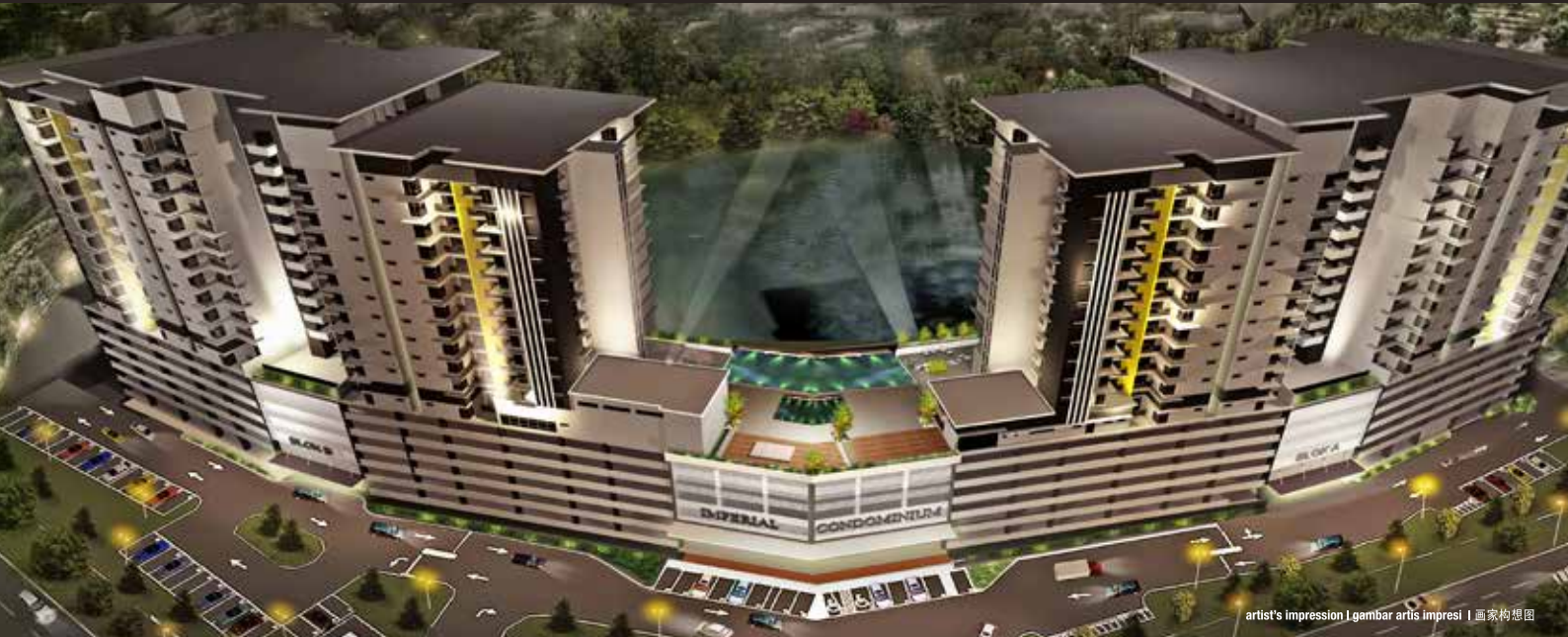
artist's impression | gambar artis impresi | 画家构想图